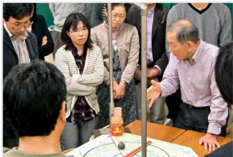
県合同教育研究集会