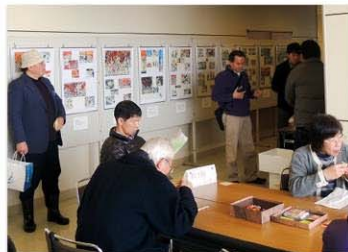
とやま憲法フェスタ (はだしのゲンパネル展)