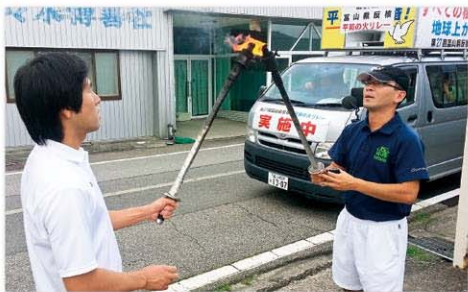
平和を訴えるリレー